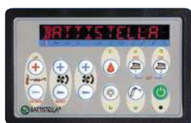
CONSOLLE COMANDI - CONTROL PANEL