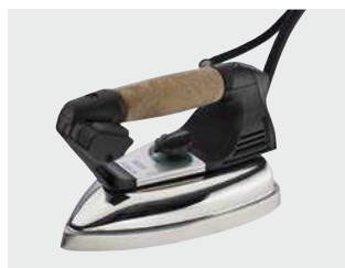
Ferro da stiro mod. EOS (fornito standard) Eos iron (standard equipment)