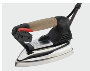
Ferro da stiro mod. EOS PRO (fornito standard) EOS PRO iron - (standard equipment)