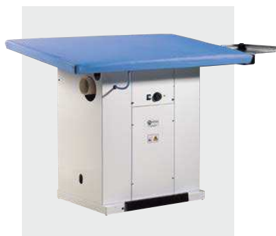
Piano stiro inclinato (su richiesta) Tilted ironing board (by request)