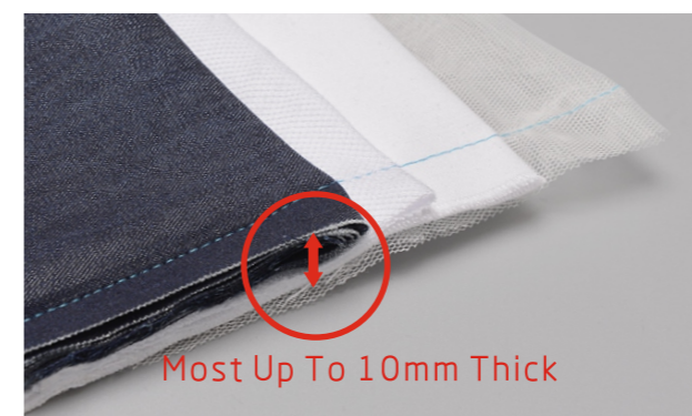
2 Per materiali leggeri e medi

Allunga la gamma di cucito, da filato fino ai jeans