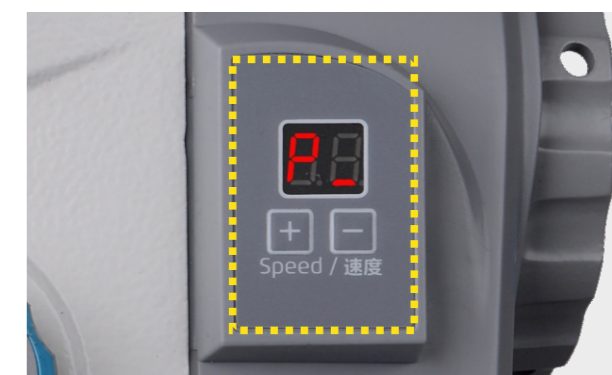
3 Pannello intelligente e facile da operare

Allunga la gamma di cucito, da filato fino ai jeans