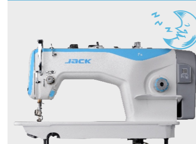
1 Motore integrato intelligente